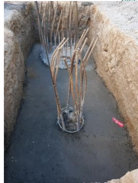
Plantilla de concreto