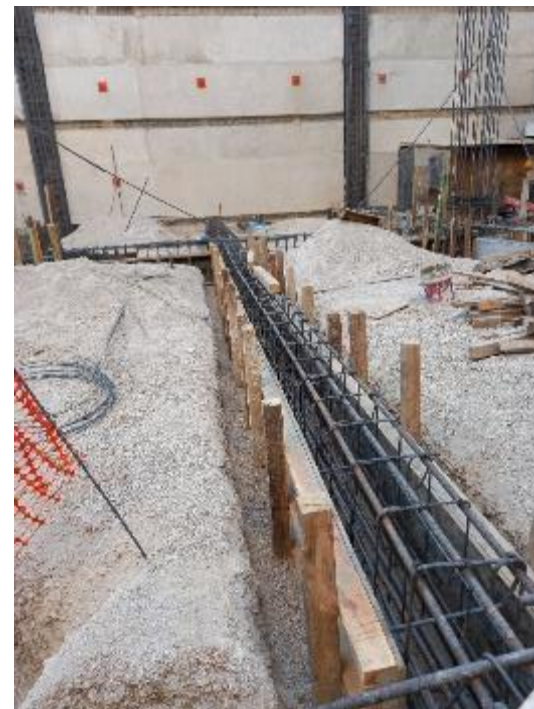
Cimbra de contrarabes, dados y cabezales