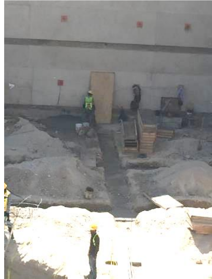
Excavación y elaboración de plantillas de contratrabes