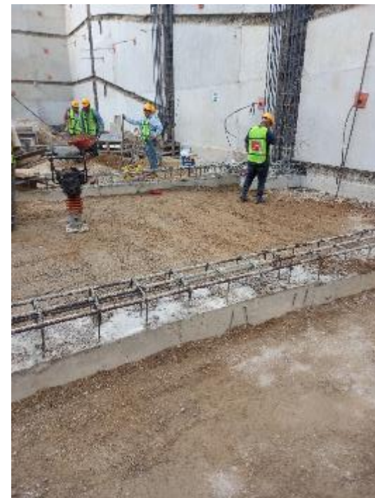
Relleno compactado con material del lugar