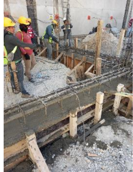
Colado de dados, contratraves y cabezales